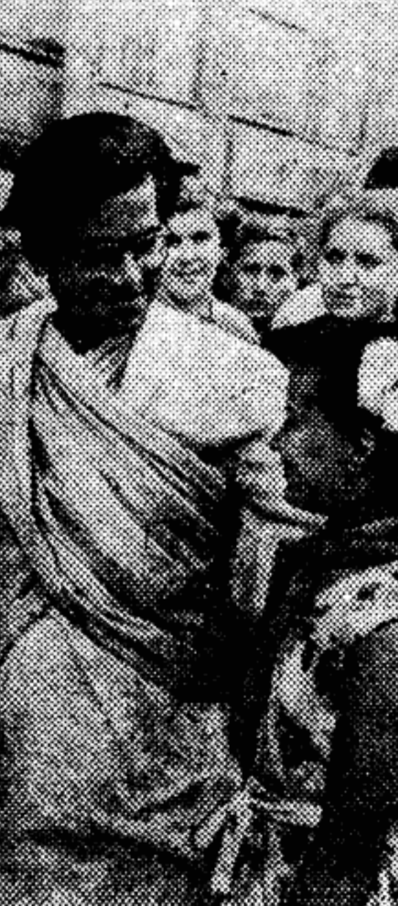
На снимке: делегаты конгресса из Индии на улицах Киева.